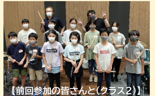
【前回参加の皆さんと(クラス2)】