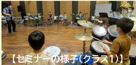
【セミナーの様子(クラス1)】