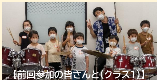
【前回参加の皆さんと(クラス1)】

*初めての方も、スティックの使い方からやりますので安心です (当セミナー初参加の方にはスティック進呈)