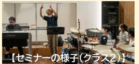
【セミナーの様子(クラス2)】